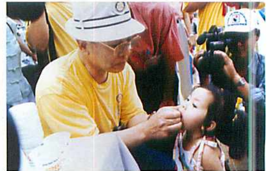
1999 (平成11) 年4月号 ポリオ・プラス・ベトナムミッション 第2650地区 関係団体多数の協力を得て、ベトナムに赴き、ポリオワクチン一斉投与を行った。メコン川に住む水上生活者の船にも一隻一隻近寄り、実施した。(1月14～21日 福井県・滋賀県・京都府・奈良県)