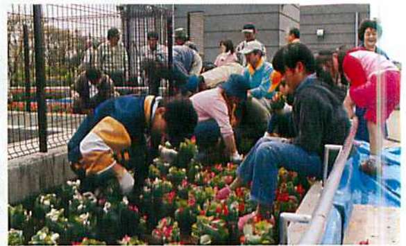
2001年 (平成13) 年9月号 老人ホーム屋上でガーデニング 大和田園RC 老人ホーム「ロゼホームつきみ野」の屋上ガーデンに、会員、家族、高校生、小学生など総勢58人で、ペゴニアなどの草花1,200本を植えた。(4月22日 第2780地区 神奈川県)