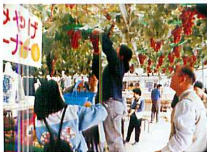
2000 (平成12) 年2月号 交通遺児家族と果実狩り 新潟RC 市内の交通遺児とその家族16人を招いて、「なし・ぶどう狩り」を行い、会員も含め総勢28人で、楽しく和やかな一日を過ごした。(1999年10月3日 第2560地区 新潟県)