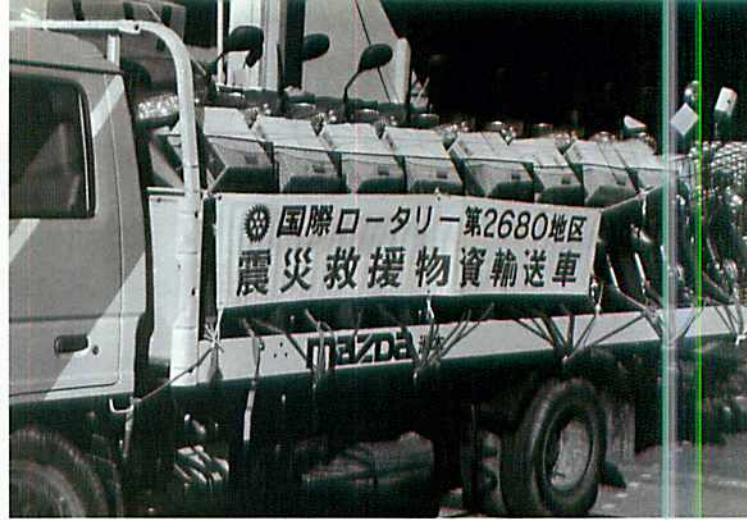
1995 (平成7) 年3月号 全国から集まった募金の一部でバイクを購入。交通網の遮断した被災地の貴重な足となった。

1月17日未明に起こった大地震は大きな被害をもたらしましたが、日本全国のロータリアンが身をもっての奉仕活動を展開しました。また、1月23～26日、ベネズエラ・カラカスで開かれたR I 規定審議会では、兵庫県南部地震の被害を軽減するために、ロータリー 506 地区を挙げて、日本のロータリアンを支援することを決議。