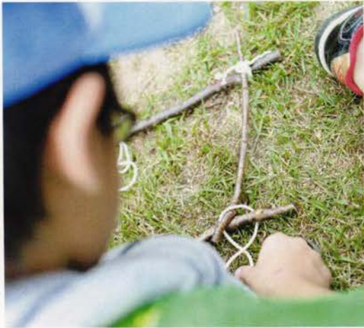
うまく結べるかな