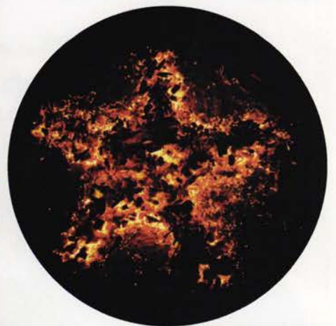
最後はきれいな星型に