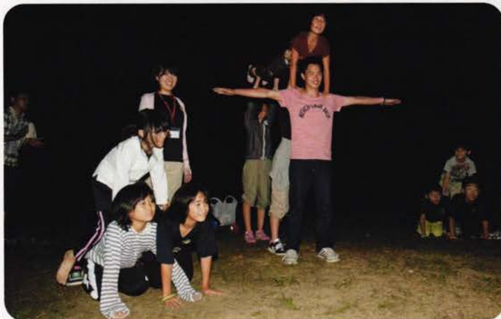
班対抗や班別のいろいろなもよおしがありました