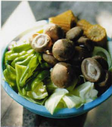
野菜もいっぱい、お肉もいっぱい！