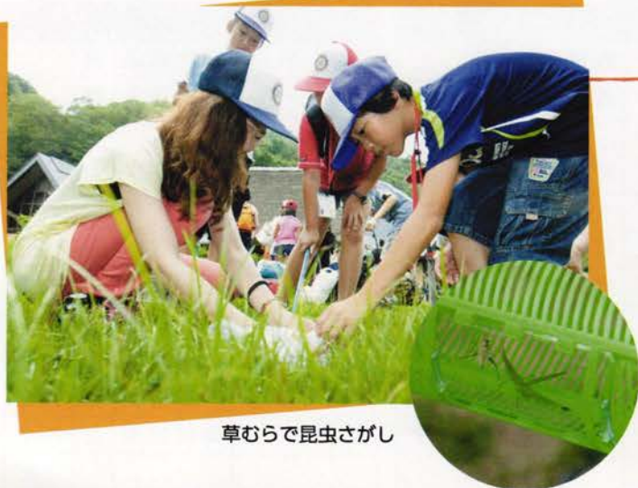
草むらで昆虫さがし