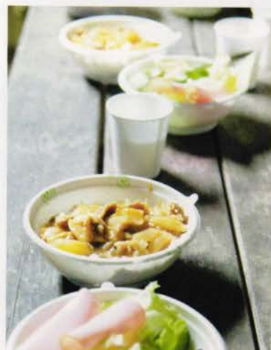
おいしくできたかな?