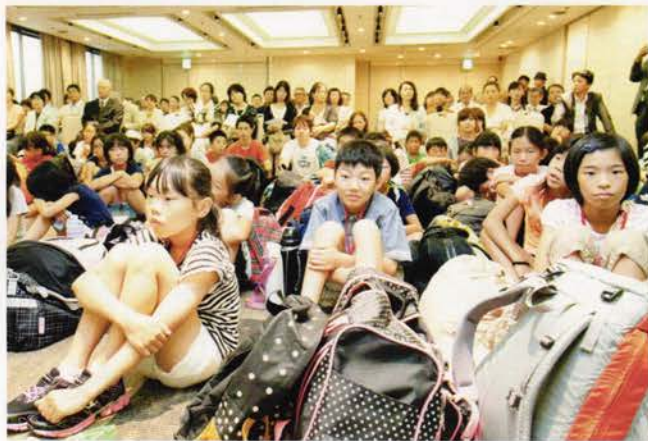
どんなキャンプになるのか、ドキドキ。