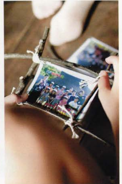
みんなで撮った写真を入れて、完成!