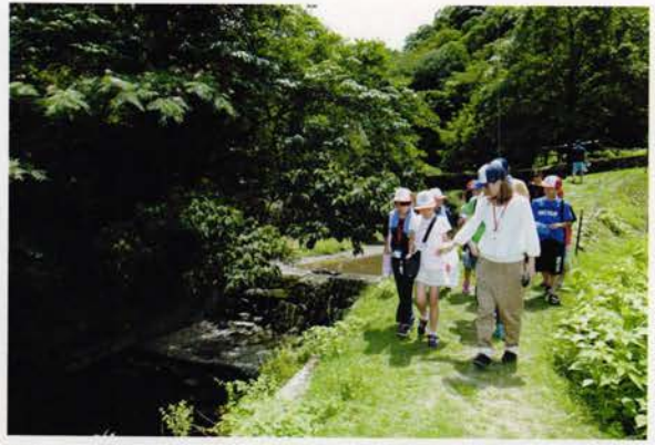
あちこち歩いてみたり、川に入ってあそんでみたり