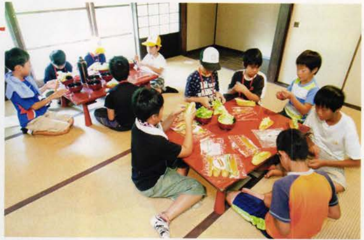
みんなで朝ごはんのホットドッグ作り