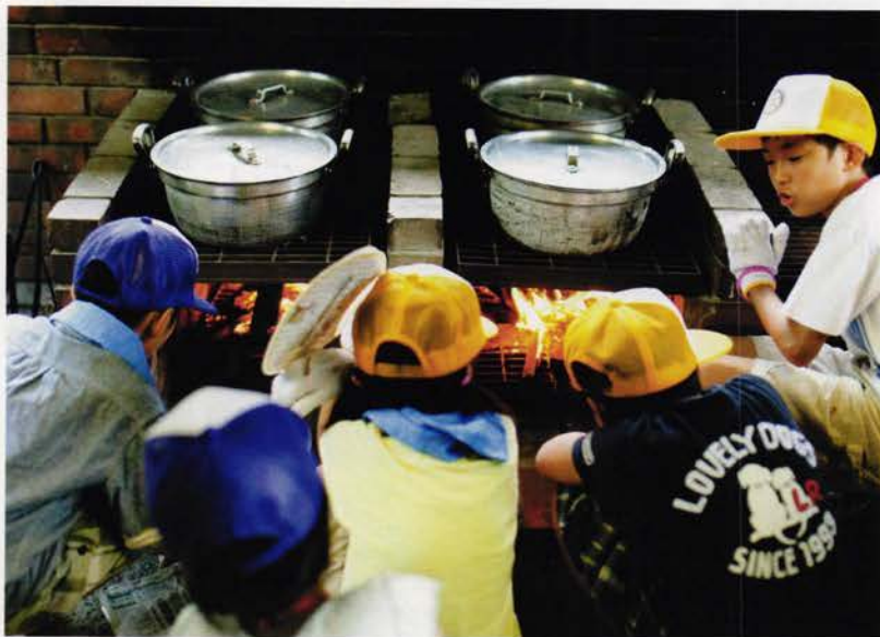
火の加減もしっかり見張ります