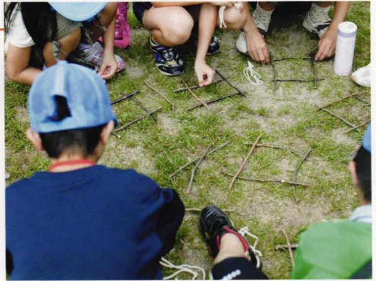
木の枝を使ったフォトフレーム作りに挑戦