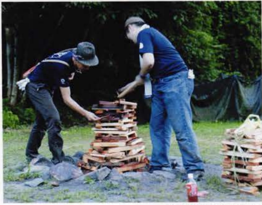
準備は明るいうちに