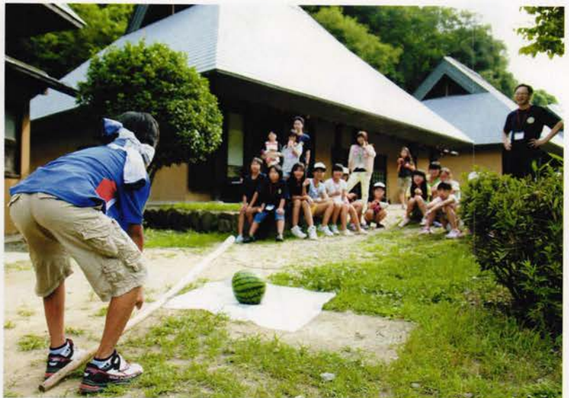
右、左!と応援の声がとびます