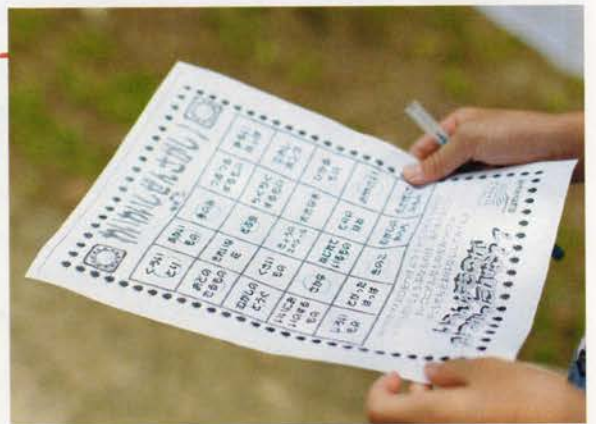
わいわいぜんさがし! いくつであえるかな