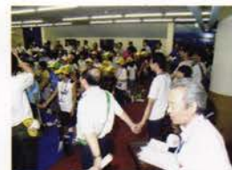
ロータリーソング「手に手つないで」