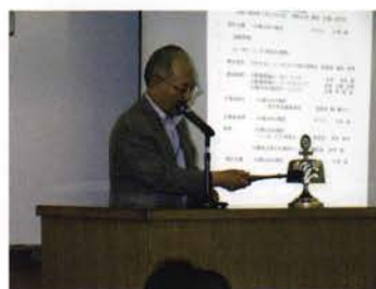
大谷ガバナーによる点鐘