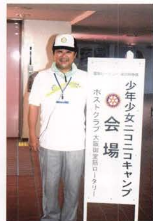
編集責任者 山田 耕司