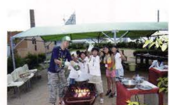
おいしくいただきます