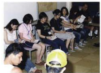
スタッフミーティング