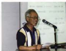
次年度ホストクラブ挨拶