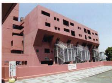
大阪府立青少年海洋センター