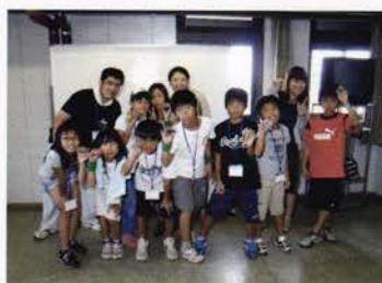
自慢のストーンアート