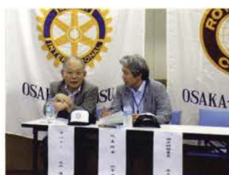
大谷ガバナーと四宮代表幹事